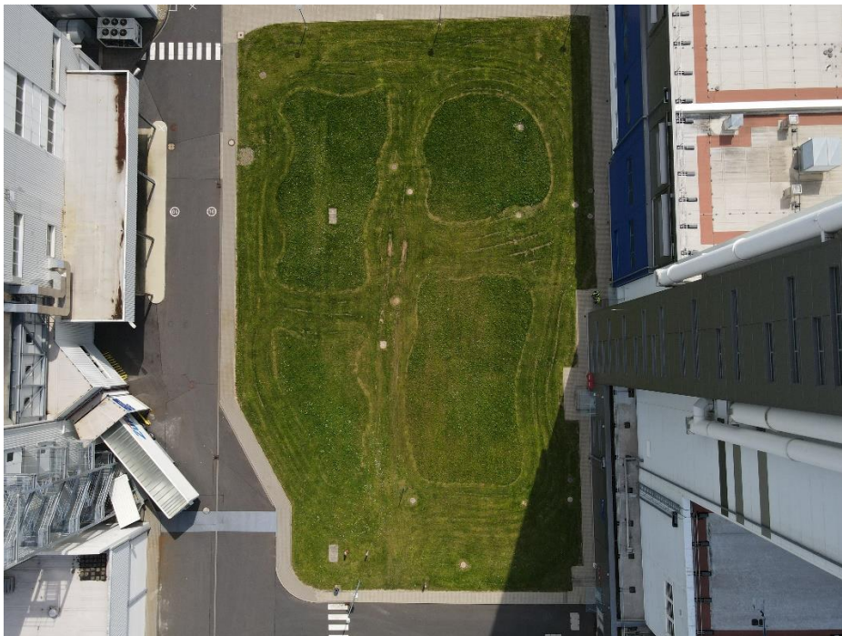
Abbildung 2: Eingerichtete Blühwiesenareale

Um die regionale Biodiversität zu verbessern, arbeiten wir seit dem Jahr 2020 an lokalen Maßnahmen. Die Umsetzung erfolgte ab dem Jahr 2021. Ein umgesetztes Projekt beinhaltet die Realisierung einer Blühwiese auf dem Werksgelände mit einer Fläche von etwa 1.000 m 2 .