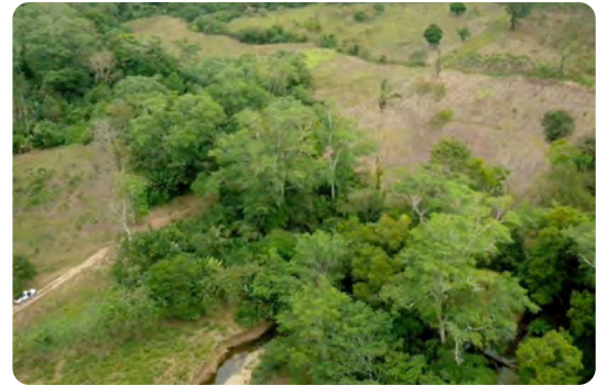
Finca „Metetí I“ in Panama – Verbleibende Waldkorridore (vorne) werden durch die Wiederaufforstung brachliegender und degradierter Flächen (Mitte) verbunden und verschmelzen zu einem durchgängigen Waldlebensraum für Tiere und Pflanzen.

In Kolumbien dient die Baumart Akazie als „Bodenverbesserer“ und ebnet den Weg für anspruchsvollere einheimische Baumarten, die auf den stark degradierten und jahrzehntelang entwaldeten Böden nicht genug Nährstoffe finden würden. Denn die Akazie verbessert die Bodenqualität, indem sie Schadstoffe filtert und ihn mit Stickstoff anreichert. Damit schafft sie die nötigen Voraussetzungen für die mittelfristige Rückführung der degradierten Fläche in einen artenreichen, nachhaltig bewirtschafteten Mischwald mit standortgerechten Baumarten. Auch hier ist das Ziel die Schaffung eines beständigen, möglichst naturnahen Waldes mit all seinen Ökosystemleistungen.