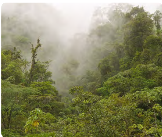
Ein Nebelwald in Panama. Die Regenwälder Mittelamerikas gehören zu den artenreichsten der Welt. Jede zehnte Spezies unseres Planeten kommt hier vor, die meisten davon endemisch.

Schutz und Förderung der biologischen Vielfalt sind integraler Bestandteil des Unternehmenskonzeptes der ForestFinance Gruppe. Das bedeutet, dass sich sämtliche Produkte und Projekte des Unternehmens positiv auf die Umwelt und insbesondere die Artenvielfalt auswirken sollen.