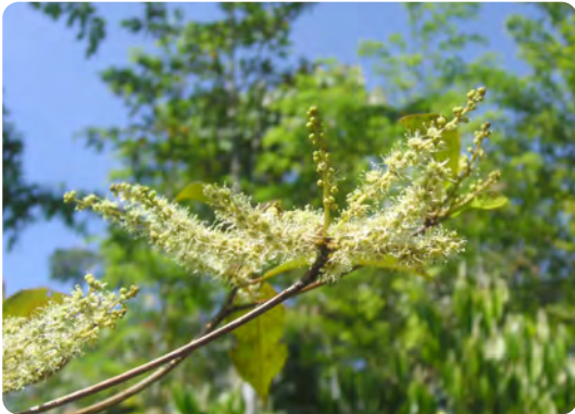
Die Blüte eines Amarillo, auch Roble coral genannt. Der botanische Name lautet Terminalia amazonia .