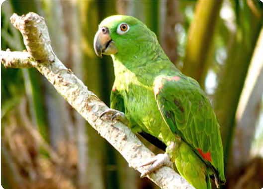
Eine Gelscheitelamazone aus der Familie der eigentlichen Papageien.

Als Ergebnis der Studie kann zum Beispiel die Finca „Los Monos“ als sogenannter „High conservation value forest“ (HCVF) eingestuft werden. So fand Luis Alvarez auf Los Monos 33 verschiedenen Baumarten, von denen fünf vom Aussterben bedroht sind: