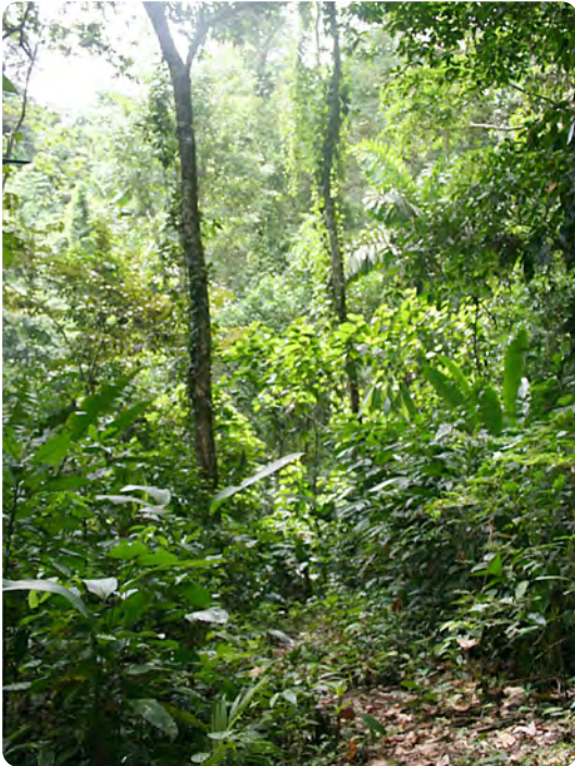
Das Waldschutzgebiet auf der Finca Quebrada Pitti in der Provinz Bocas del Toro, Panama.