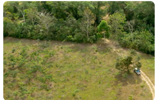
Luftbild mit Vorher/Nachher-Effekt: Karges Weideland grenzt an eine der Aufforstungsflächen in Panama