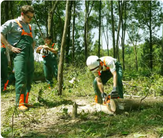
Waldarbeiter in Vietnam lernen bei einem Workshop nicht nur den sicheren Umgang mit Motorsägen, sondern auch nachhaltige Forstwirtschaft.