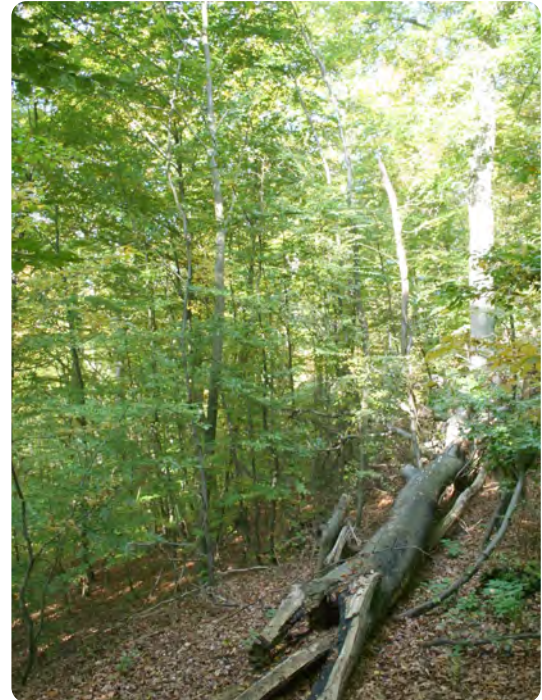
Das Waldreservat „Wilde Buche“ besteht aus Flächen mit über 190 Jahre alten Buchen.

Zu Beginn des Jahres 2012 wurde das Projekt Waldreservat „Wilde Buche“ als einer der herausragenden „365 Orte im Land der Ideen“ im Deutschland-Wettbewerb ausgezeichnet. Die Preisverleihung fand am 13. Juni 2012 in der Gemeinde Hümmel statt.