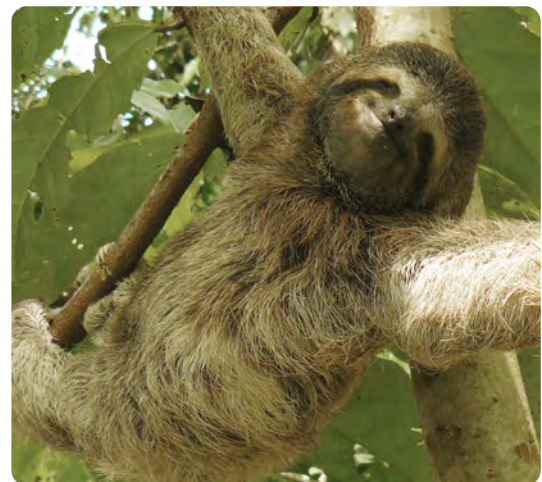
Junges Faultier auf der ForestFinance Kakaoplantage Quebrada Limon, Panama.