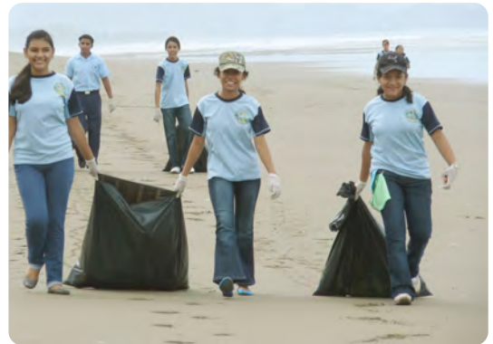
In Zusammenarbeit mit ANAM und einer Schule aus Chiriqui säubern ForestFinance Mitarbeiter den Strand von Las Lajas am „Tag der Strandsäuberung“.