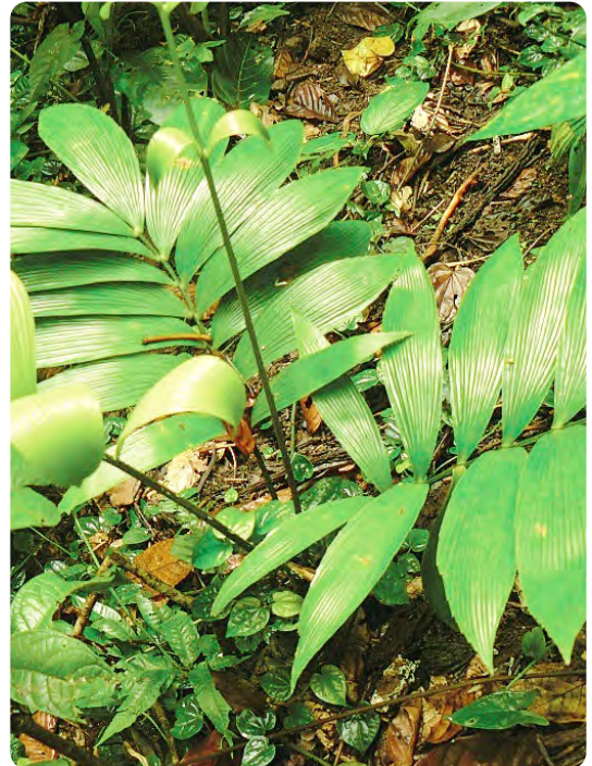
ForestFinance schützt Zamia skinneri , einen raren Palmfarn, auf der Finca Quebrada Pitti an der Karibikküste Panamas.

Das Washingtoner Artenabkommen versucht entsprechend die Zamia zu schützen und setzt sie in der CITES (Convention on International Trade in Endangered Species), auf die Liste der bedrohten Arten. Auch sind der Handel sowie der Export der Pflanze verboten. Durch das seit 2012 anlaufende Waldschutzprojekt in Kooperation mit Viebrockhaus wird der Fortbestand u.a. der Zamia skinneri auf der Quebrada Pitti dauerhaft gesichert.