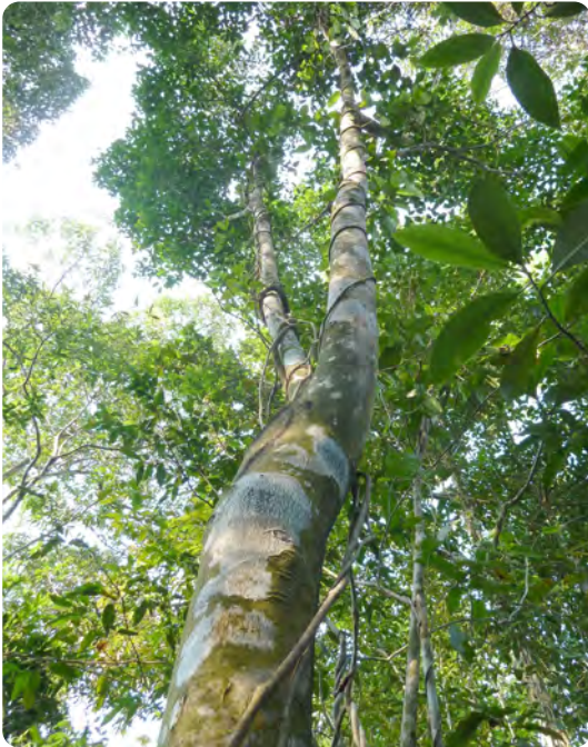
Eine Akazie in den Wäldern unseres Forstdienstleister in Vietnam.

ForestFinance setzt die Forstdienstleistungen an den Projektstandorten größtenteils mit eigenen Forstunits selber um (Peru, Panama). An anderen Standorten arbeitet ForestFinance mit Dienstleistern zusammen, die das Forstmanagement nach Vorgaben von ForestFinance und unter strengem Controlling durchführen. Alle ForestFinance-Experten vor Ort werden in unseren nachhaltigen Forstmethoden geschult.