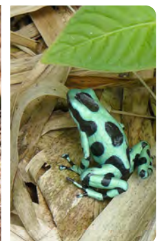
Kolibris (links: Breitschwanzkolibri Selasphorus platycercus) ernähren sich vorwiegend von Blütennektar. In den Blüten sammeln sich zudem Insekten, die ebenfalls von den Kolibris gefressen werden und eine ausreichende Versorgung mit Eiweiß sicherstellen. Der Pfeilgiftfrosch Dendrobataus spec. lebt auf der ForestFinance-Cacaofinca Quebrada Limon in Almirante.