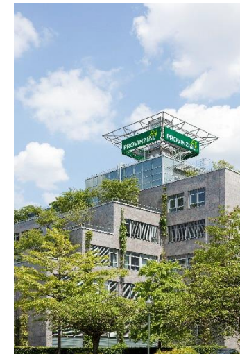
Bilder: G&C Club Seddiner See AG; Wärmeanlagen Chemnitz GmbH; ALB-GOLD Teigwaren GmbH; OBW Emden, Reckhaus; Provinzial Rheinland Versicherungen Düsseldorf..